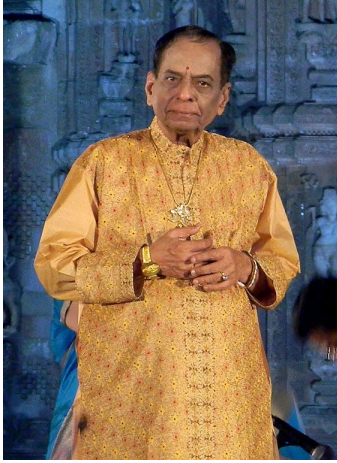
Dr.Mangalampalli balamuralee krishna .